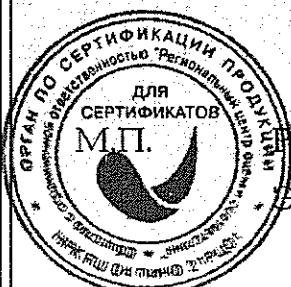
Схема сертификации 2с, инспекционный контроль 1 раз в год.