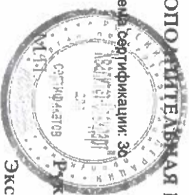
Схема сертификации: З0