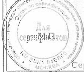
Схема сертификации: 1с.

Место нанесения знака соответствия: на изделии, на упаковке и технической документации