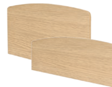
Лито / Лито реха